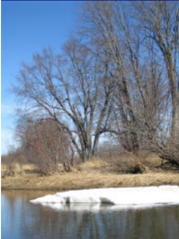
Rivière Pollett, 30 mars 2006