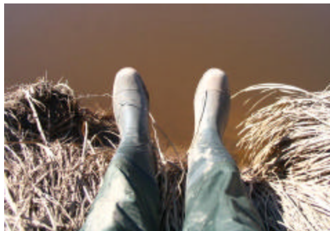
Assis sur le bord du ruisseau Fox, en train de calibrer l'équipement